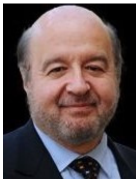
Hernando de Soto

Du 14 au 16 avril 2016 Maison de la Paix, Genève