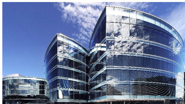
Maison de la Paix